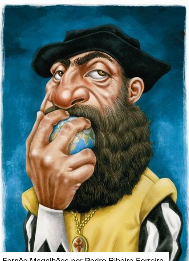
Fernão Magalhães por Pedro Ribeiro Ferreira

O artista belga Luc Descheemaeker conquistou o Grande Prémio do 21º PortoCartoon-World Festival, organizado pelo Museu Nacional da Imprensa e subordinado ao tema LÍNGUAS E MUNDO . A obra vencedora intitula-se "Money Language" e representa Trump, com uma língua de dólares.